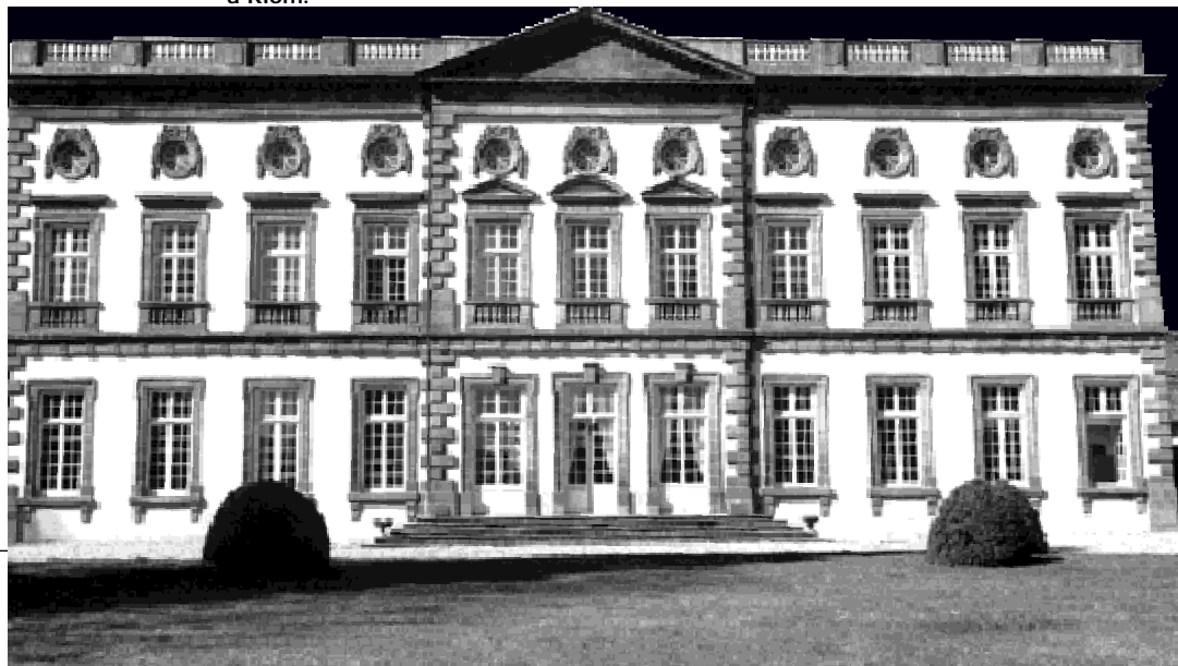
Le Château de Mirabel à Riom.

À cette époque, Clermont, Montferrand et Riom connurent "une véritable fièvre de bâtir" . L'étude des châteaux et des maisons de plaisance révèle aussi "l'importance (inattendue) du nombre d'édifices construits ou remaniés durant cette période (plus de soixante) et montre la réelle qualité de certains de ces châteaux, tant pour l'architecture, le décor ou les jardins" . Au XVIII ème siècle, la ville est pensée en vue d'une circulation aisée et rapide. Clermont aménage la rue Neuve (rue du Onze Novembre), premier grand exemple d'une opération d'embellissement accompagnée d'un programme architectural.