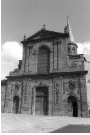
L'église Saint-Amable, à Riom.