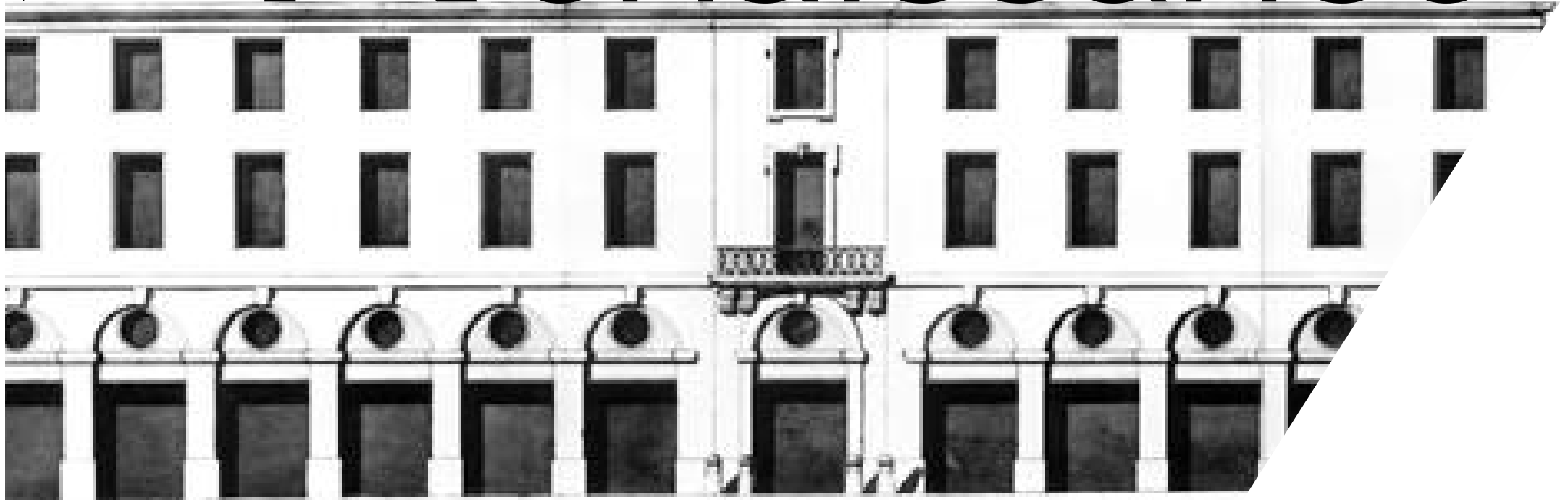
Clermont, rue Neuve (actuelle rue du Onze Novembre). Projet d'élévation, 1781, par Antoine Deval.