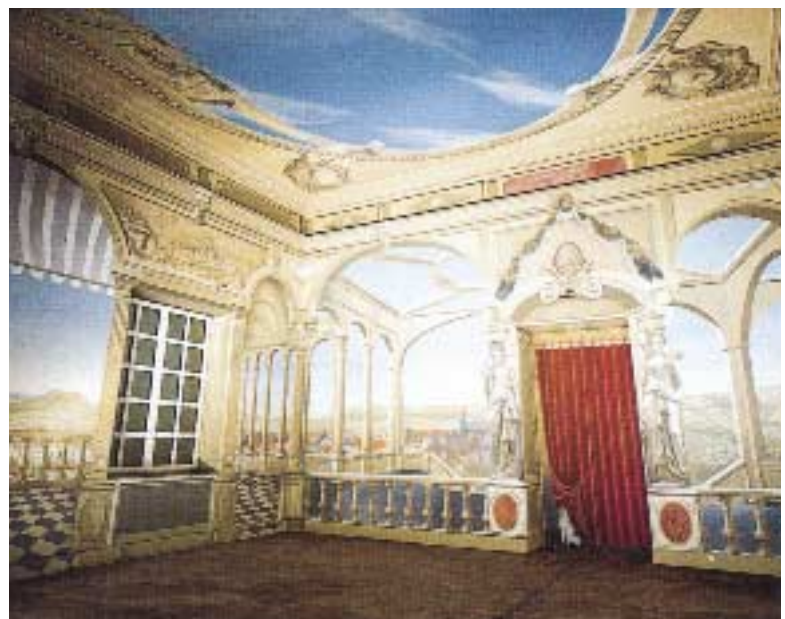
La salle des mariages, dans les locaux de la Ville de Clermont, peint par Slobo.

Clermont Ferrand / Tél. Fax : 04 78 90 64 41 www.GrandAngle.net - camus.c@wanadoo.fr