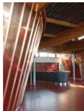
Le bar se niche entre les deux espaces festifs, qui peuvent fonctionner en autonomie.

Lors de sa mise en service, le "complexe..." s'est heureusement abrégé en Astragale, du nom d'une plante protégée, et donc symbolisant l'union de l'homme et de la nature : cette légumineuse papilionacée méridionale pourrait prendre racine dans le microclimat des côteaux cournonnais. On espère que ce présage est le bon. Car le mot désigne aussi une mouleure en hauteur de colonne, ainsi qu'un os du pied dont la fracture est fort sensible : il faut souhaiter qu'aucun fêtard en quête d'exploit de fin de soirée n'aille chercher la première sur un des poteaux d'entrée – où elle n'est pas –, au risque de chuter sur la seconde, et de se faire moquer sur le thème "eh bien, dansez maintenant !"